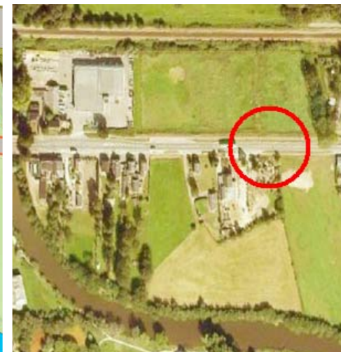
Nieuwe brug Wierdensestraat