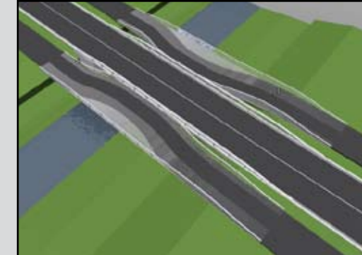
Impressie water en faunapassage Wierdensestraat