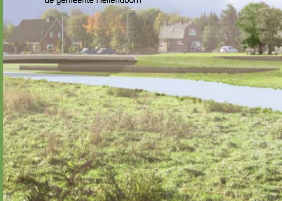
Impressie nieuwe hoofdgeul Regge en natuurontwikkeling