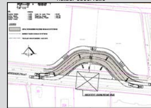
Impressie tijdelijke verlegging Wierdensestraat