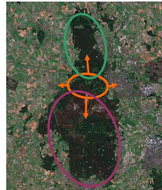
Figuur 3 De Noordrand als schakel

Bezoekers voor een kort uitstapje (denk aan mensen die moeilijker ter been zijn en gezinnen met kinderen) zullen vooral in de Noordrand blijven. Meer actieve bezoekers kunnen besluiten om vanuit de Noordrand ófwel naar het centrale heide gedeelte van het Nationale Park te gaan voor rust,